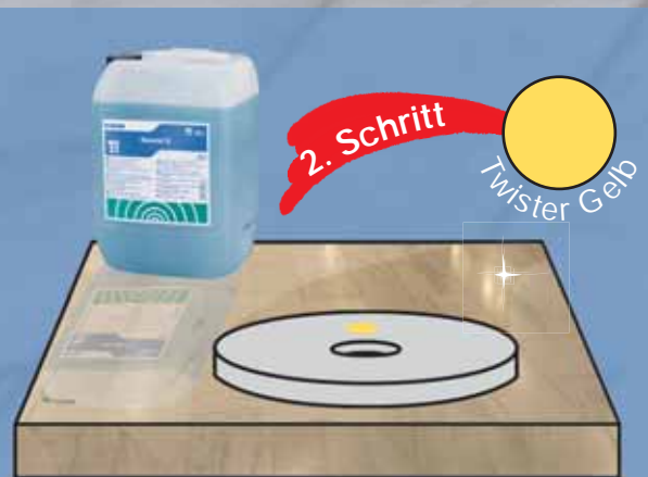
Vorbereitung zum Hochglanz