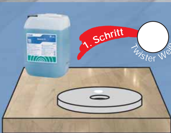
Intensivreinigung zum Hochglanz